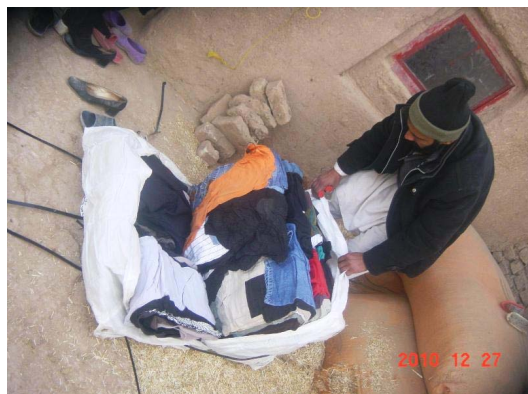
Distribution de vêtements d'hiver